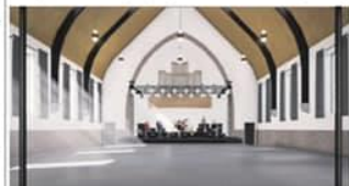
De Bron van binnen.

Kerkdienst met ds. Glashouwer. De kerkdienst wordt gehouden op zaterdag 18 mei om 10:00 uur. De kerkdienst wordt gehouden op zaterdag 18 mei om 10:00 uur. De kerkdienst wordt gehouden op zaterdag 18 mei om 10:00 uur.